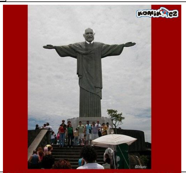
Chcete-li se se sochou vyfotit, není to jednoduché. Těžko se vám vejde do záběru.

Předvedli nenažranost mocných, kteří potřebují k uvelebení se na svém zadku několik židlí. Předvedli, jak se mohou na sebe lidé usmívat a v kapse držet nůž na podříznutí toho, na